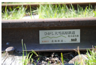
金属製命名権プレート

この企画はひがし大雪高原鉄道のまくら木の所有権、占有権を命名権者に譲渡するものではありませんので、この点をご承知の上、お申し込み下さい。11月中旬から5月中旬までは、現地が積雪のためにプレートの設置ができなくなりますので、ご理解をお願いします。