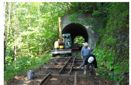
第三音更川橋りょう